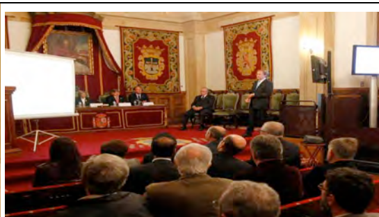
Homenaje al Prof. Barluenga (Symposium on Selective Synthesis)