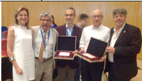
Entrega de las Medallas del GEQOR en la Bienal de Alicante

Por otra parte a través de la página web y del twitter hemos dado difusión a diversas actividades científicas, cursos, simposios, congresos nacionales e internacionales y sobre todo difusión de ofertas de trabajo. La web está demostrando ser un excelente vehículo para canalizar la información que interesa a nuestros socios.