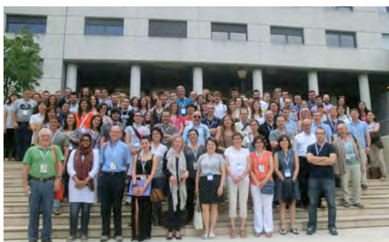
Escuela de Química Organometálica MMM en Barcelona.